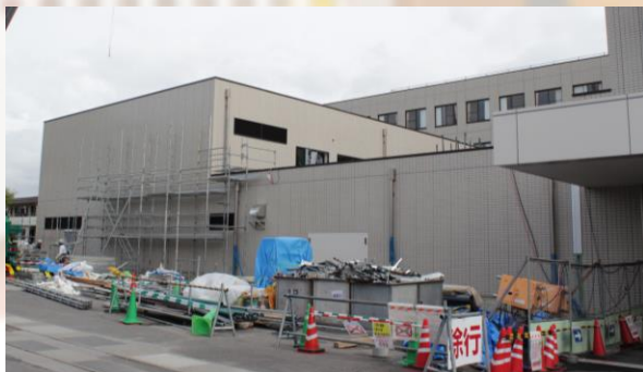
北低層棟は外観が現れた

北低層棟とドック健診センターが7月のオープンを目指して工事が進んでいます。既存部分では南病棟のナースコール更新工事が行われ、すべての病棟が動き始めました。内視鏡室も完成し7月のオープンを待つ他、内科外来が6月、産婦人科外来は7月の完成を予定しています。外来診察室の改修工事では、仮間仕切りが設置され騒音や臭気などの影響が出ていますが、工事業者と協力しながら検討していますので、引き続きご理解とご協力をお願い致します。